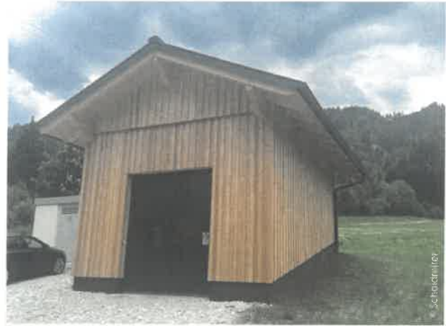
Das neue Kraftwerk im Pongauer Kleinarl liefert im Regeljahr durchschnittlich 1,3 GWh grünen Strom ans Netz.

wegs positivem Verlauf von Beginn an. Besonders erfreulich für die Betreiber: Das Projekt konnte vollständig im vorgesehenen Zeit- und Kostenrahmen umgesetzt werden. Im Regeljahr erzeugt das Kraftwerk künftig circa 1,3 Gigawattstunden Strom, der über die Energie AG an der Strombörse vermarktet wird. Für die jungen Betreiber markiert das Projekt gleichzeitig den Beginn eines neuen Abschnitts: Mittlerweile vom „Wasserkraft-Virus“ erfasst, tüfteln sie bereits an den nächsten Kraftwerksideen und sehen im erfolgreichen Abschluss des Kraftwerks Ployergrabenbach vor allem einen Ansporn für weitere innovative Energieprojekte in der Region. 🌱