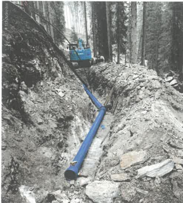
Die Hänge des Ployergrabens gelten als stark hydromorph und geologisch instabil. Umso wichtiger war es, dass die gesamte Druckrohrleitung schub- und zugesichert ausgeführt wurde.

keine allzu großen Unterschiede. Aber: Wir hatten bei etwas billigeren Anbietern kein so gutes Gefühl, was die Qualität und Langlebigkeit anbelangt.“