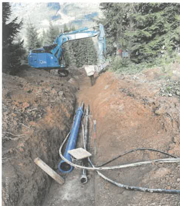
Parallel zur neuen Druckrohrleitung wurden in der Künette auch eine neue Schneileitung sowie Strom- und LWL-Kabel mitverlegt.

Neben der Wahl der optimalen Maschinenteknik legte das Betreiberquartett auch größtes Augenmerk auf eine moderne Steuerungs- und Automatisierungslösung für das Kraftwerk. Nach Besichtigung einiger Kleinkraftwerke im Vorfeld entschieden sich Christof Schaidreiter und seine drei Mitstreiter für die Steuerungslösung aus dem Hause en-co. „Un-