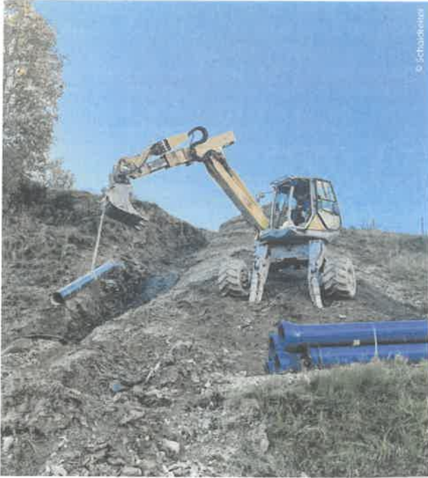
Für den Kraftabstieg wurden Gussrohre von TRM über eine Länge von knapp 2,2 km in teilweise schwer zugänglichem Gelände verlegt. Die Druckrohrleitung wurde in der Dimension DN250 errichtet.