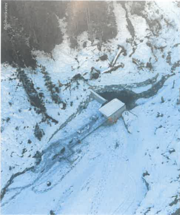
Die Wasserfassung im Winter auf rund 1.511 m Seehöhe aus der Drohnensicht. Sie wurde sehr robust ausgeführt.