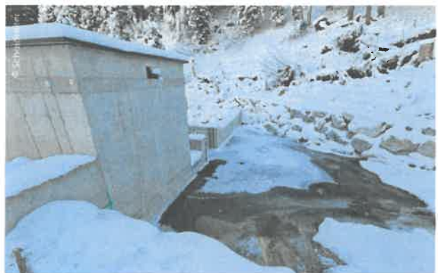
Ein eigener Wintereinlauf sorgt dafür, dass auch bei tiefwinterlichen Bedingungen an der Wasserfassungen Triebwasser eingezogen wird.