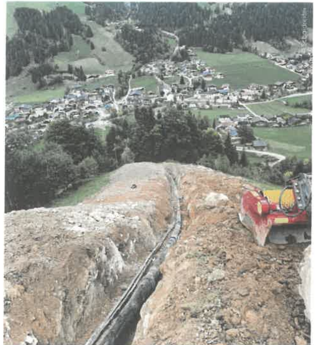
Dem beauftragten Bauteam von AustroBau GmbH gelang es, die gesamte Druckrohrleitung von Juli bis November letzten Jahres zu verlegen. Begünstigt wurden die Arbeiten durch die außergewöhnliche Trockenheit.

dass dieser Umstand auch bei der Verlegung der Druckrohrleitung eine Rolle spielen sollte.