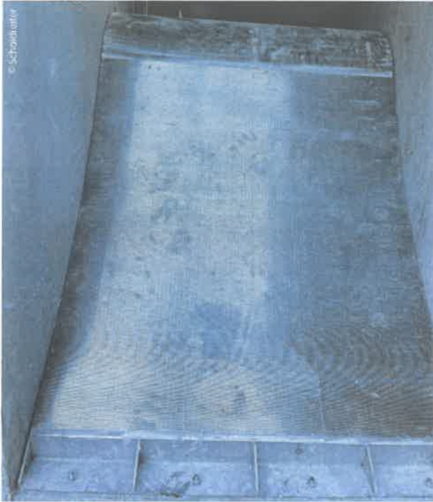
Der Ployergrabenbach ist bekannt für seine hohe Geschiebefracht. Daher wurde auf die Entsandung besonders großer Wert gelegt. GMT lieferte für die Fassung einen angepassten Coanda-Rechen.