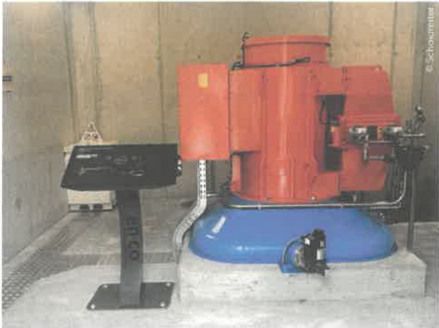
Die 3-düsige Pelton-turbine aus dem Hause sora, ausegelegt auf eine Nennleistung von 400 kW, arbeitet auch im Teillastbereich hoch effizient.

ser Ziel war es, die Anlage langfristig möglichst störungsfrei und mit geringem Betreuungsaufwand betreiben zu können. Die benutzerfreundliche Visualisierung und das durchdachte Bedienkonzept von en-co haben uns dabei überzeugt“, so Schaidreiter. en-co zeichnete für die Automatisierung, die Anlagensvisualisierung, die Fernüberwachung sowie das moderne Bedienkonzept verantwortlich. Sämtliche Betriebszustände und mögliche Störungen können in Echtzeit am Smartphone überwacht werden, wodurch sowohl Kontrolle als auch Steuerung aus der Ferne möglich sind. Zusätzlich realisierte en-co ein eigenes Bedienpanel mit einem 32-Zoll-Bildschirm auf einem speziell dafür entwickelten Steuerpult, das eine moderne, übersichtliche und intuitive Anlagenbedienung ermöglicht. Durch die enge Abstimmung zwischen sora und en-co entstand eine durchgängige elektromechanische Gesamtlösung für einen effizienten und betreiberfreundlichen Kraftwerksbetrieb.