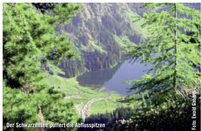
Der Schwarzensee puffert die Abflussspitzen

Damit stellt es auch einen weiteren wichtigen Baustein in der Energieversorgung der Region dar. Es repräsentiert eines von 10 Kraftwerken, die heute vom E-Werk Gröbming entweder als Mehrheitseigentümer oder – wie in diesem Fall – als Minderheitseigner betrieben werden. „Unser Netzverbrauch liegt im Jahr bei rund 36 GWh. Mit den 10 Kraftwerken kommen wir auf eine Gesamterzeugung von etwa 60 GWh. Das sieht natürlich schöner aus, als es ist. Im Sommer wird in Abhängigkeit vom Netzverbrauch Überschussstrom produziert, im Winter fällt die Gesamt-Produktionsleistung auf ca. 15 % ab – und das bei höchstem Netzverbrauch“, erklärt Horst Messner und verweist damit auf die Kehrseite der typischen Verhältnisse alpiner Wasserkraftnutzung. Nichtsdestotrotz hat man sich in Gröbming und im Sölktaal der Wasserkraft verschrieben. Mehrere brandneue Kraftwerke zeugen davon – darunter das neue KW Schwarzenseebach als jüngstes „Baby“.