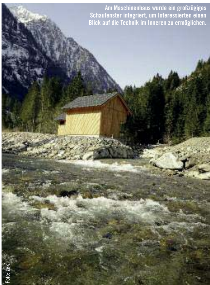
Am Maschinenhaus wurde ein großzügiges Schaufenster integriert, um Interessierten einen Blick auf die Technik im Inneren zu ermöglichen.